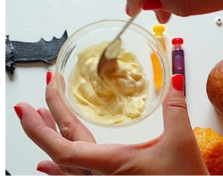
FAIS FONDRE LE CHOCOLAT