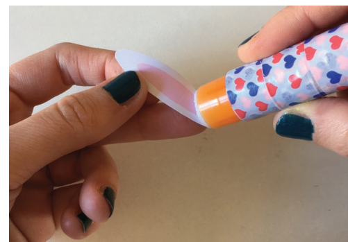
Coller les oreilles sur le derrière de l'oeuf