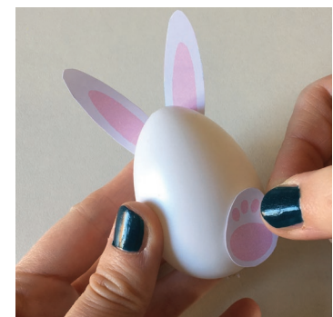
Puis les pattes sur le devant