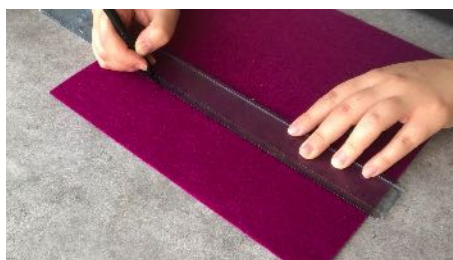
Marquer espacements 2 cm