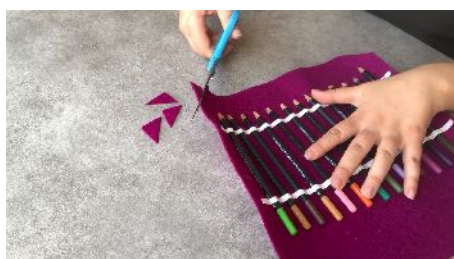
Couper les coins