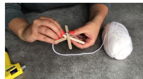
L'enrouler autour de Vos bâtonnets