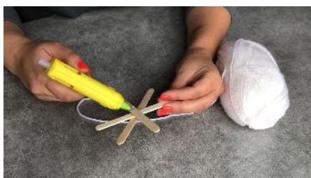
Colle le début de votre laine