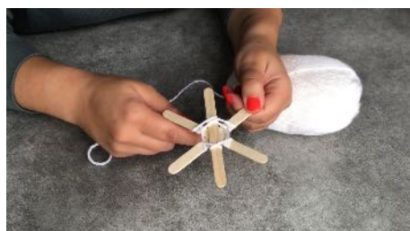
Au dessus du bâtonnet