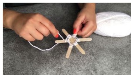
L'enrouler en faisant un tour arrière sur le dessous