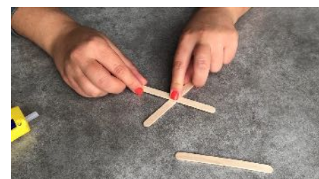
Coller les bâtonnets en leur milieu en créant d'abord un croix