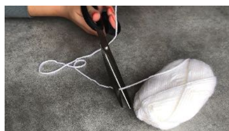
Couper à 20 cm