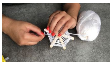
Coller la laine