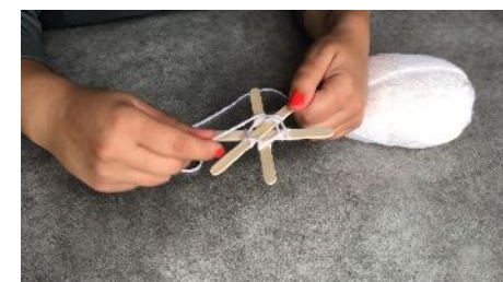
Repasser sur le devant et aller vers l'autre bâtonnet en passant sur le devant