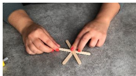
Coller le 3ème bâtonnet Au milieu de la croix