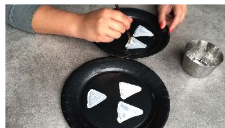
Peindre des triangles