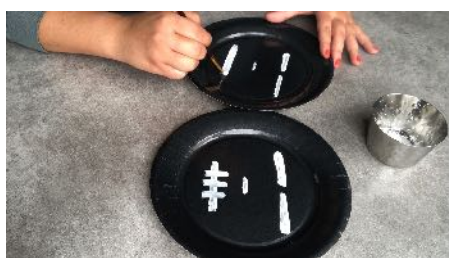
Peindre des traits