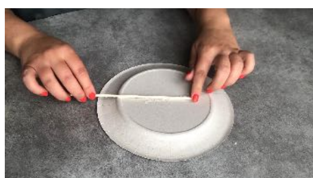
Coller au dos de l'assiette