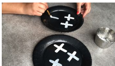
Peindre des croix