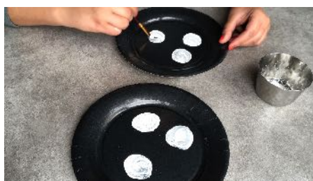
Peindre des ronds