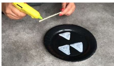
Encoller les bâtonnets