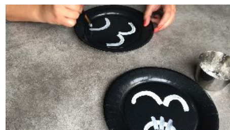
Peindre des courbes