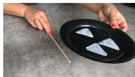
Placer les bâtonnets dans le sens des dessins