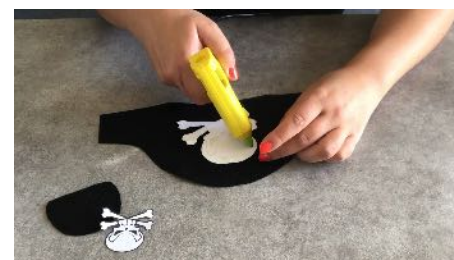
Coller la grande tête de mort sur le chapeau