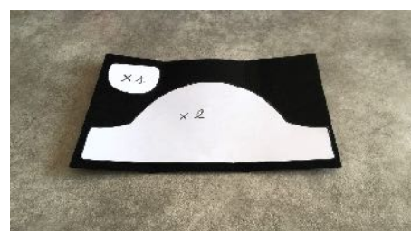
Découper les formes Dans la feutrine