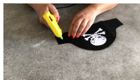
Coller le devant du chapeau Avec l'arrière du chapeau Sur chaque côte