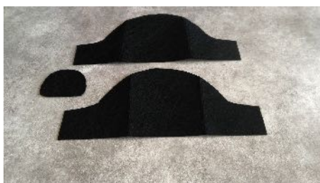
Découper les formes Dans la feutrine