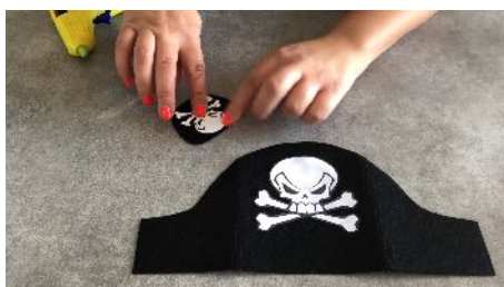
Coller la petite tête de mort sur le cache œil