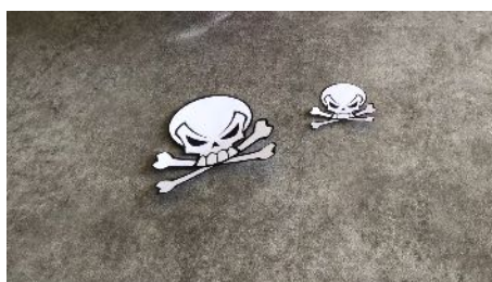
Découper les têtes de mort