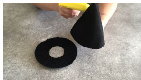
Coller le cône pour le maintenir