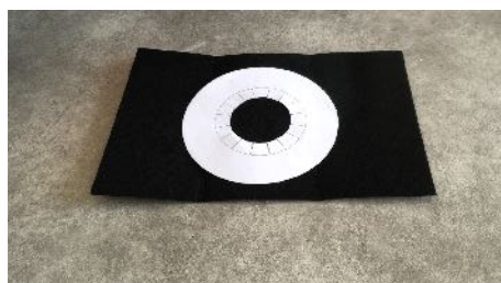
Découper les formes Dans la feutrine