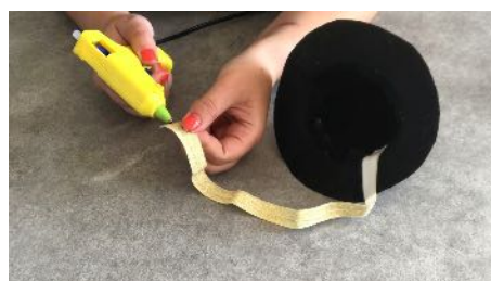
Coller le ruban élastique à l'intérieur du chapeau