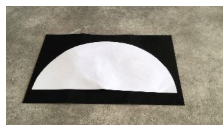
Découper les formes Dans la feutrine