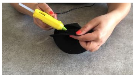
Coller le bord du chapeau Au cône