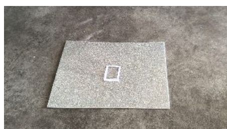
Découper la boucle dans le papier mousse