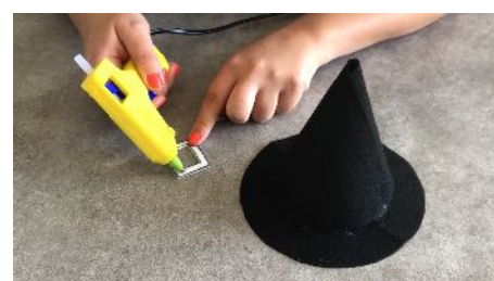
Encoller la boucle