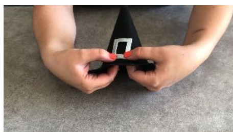
Coller la boucle sur le chapeau