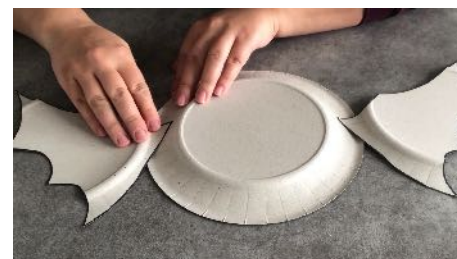
Coller les ailes au dos D'une autre assiette