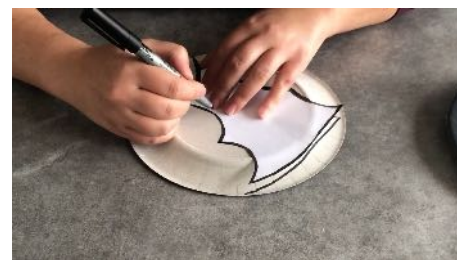
Reporter les gabarits Au dos d'une assiette