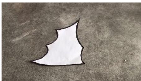
Découper votre gabarit