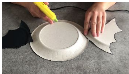
Coller les ailes au dos D'une autre assiette