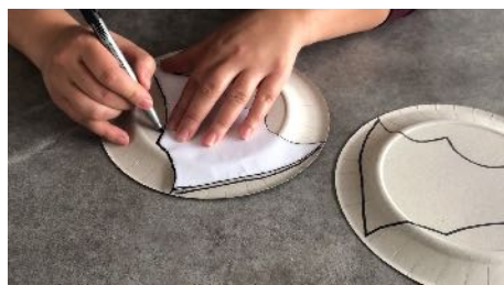
Reporter le gabarit dans l'autre sens sur une 2 ème assiette