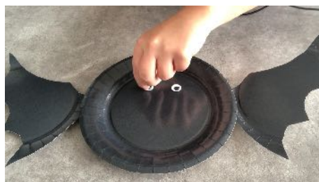
Coller les yeux