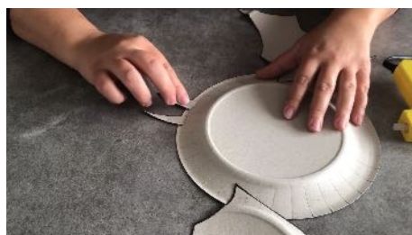
Coller les oreilles au dos De l'assiette