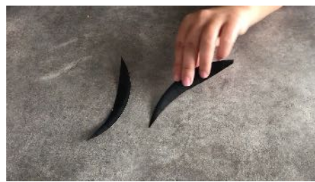
Récupérer des chutes pointues Des autres assiettes découpées