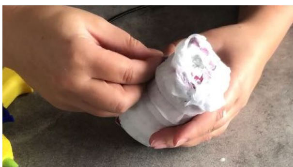
Coller les yeux