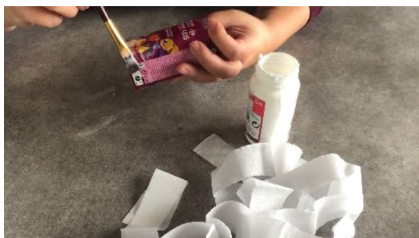
Encoller la brique de jus de fruit