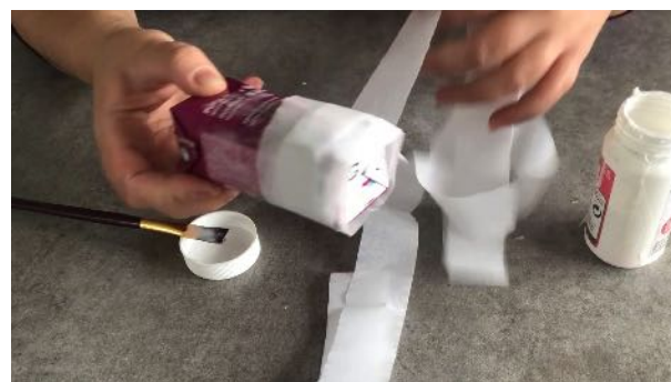
Enrouler la brique avec votre Bande de papier crépon