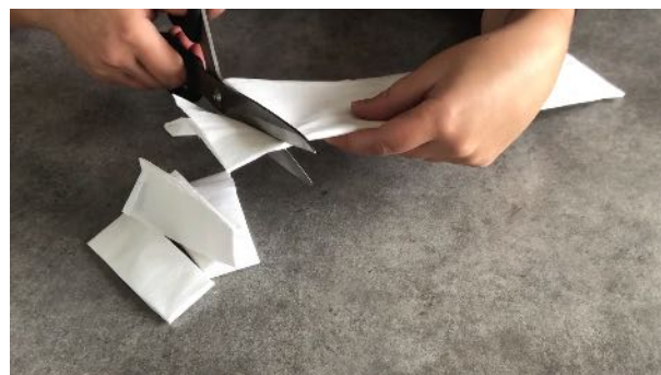
Découper des bandes de crépon blanc