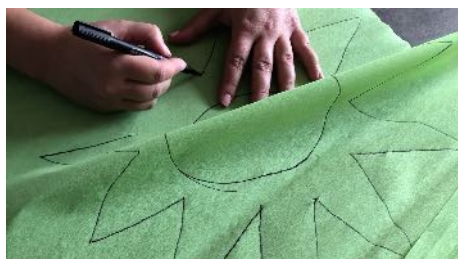
Dessiner une grande fleur sur le crépon vert