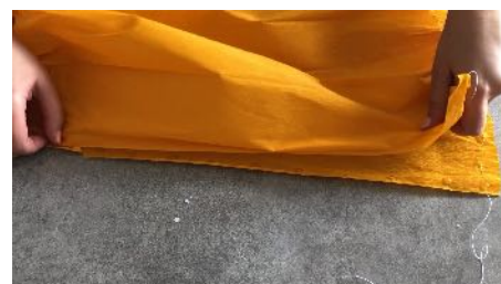
Fermer le dos en pliant en 2 et coller