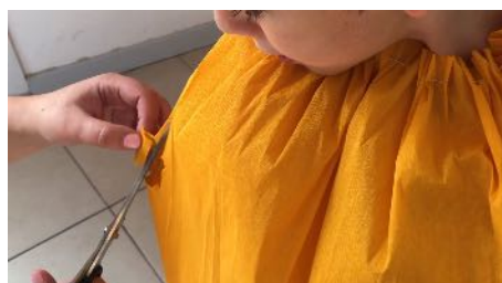
Faire des ouvertures de chaque côté pour passer les bras