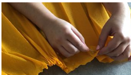
Faufiler le crépon orange avec le fil élastique, en bas et en haut