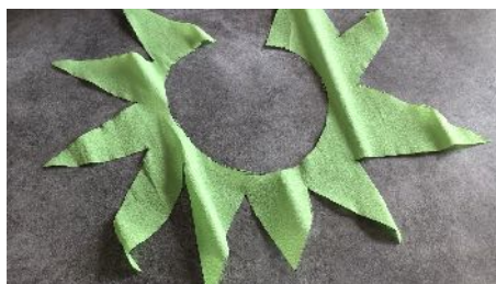
Découper la fleur