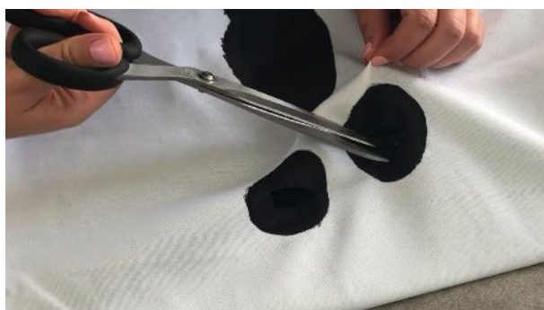
Découper les yeux