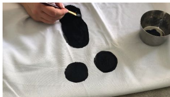
Peindre la bouche avec la peinture noire