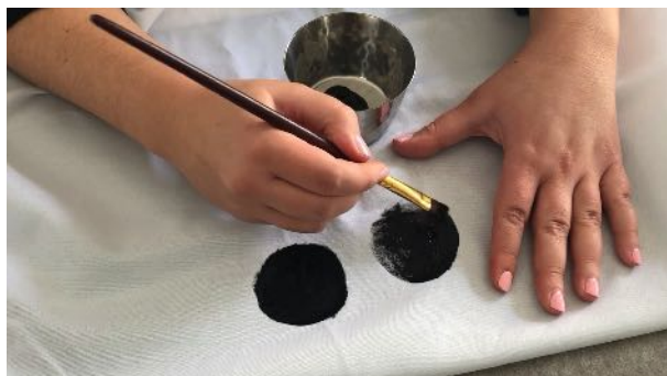
Peindre les yeux avec la peinture noire