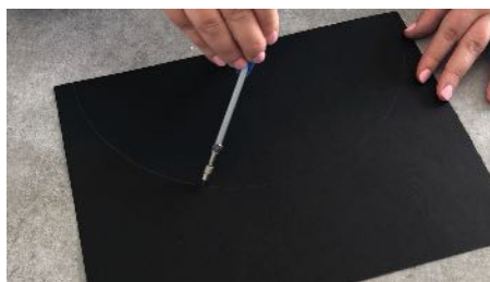
Tracer un demi cercle