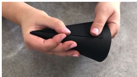
Former un cône avec le demi cercle