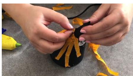
Coller les bandes de crépon