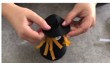
Coller le chapeau