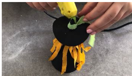
Coller le crépon vert sur le chapeau