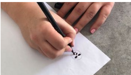
Dessiner un visage