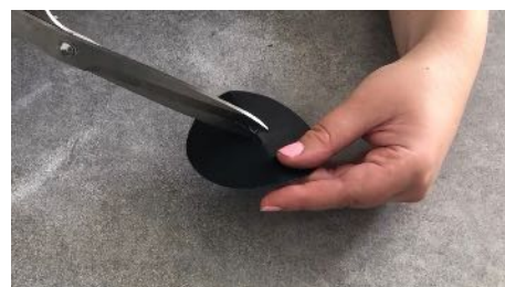
Cranter le cercle pour faire une ouverture au centre