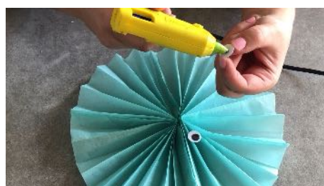
Coller les yeux sur la rosace