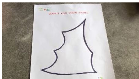
Imprimer et découper le gabarit