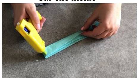
Coller et refaire les mêmes opérations