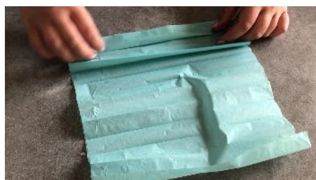
Replier la feuille en accordéon