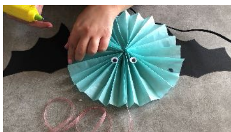
Coller les ailes sur la rosace