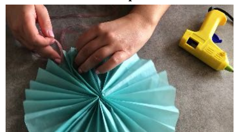
Coller un bout de ruban sur la rosace