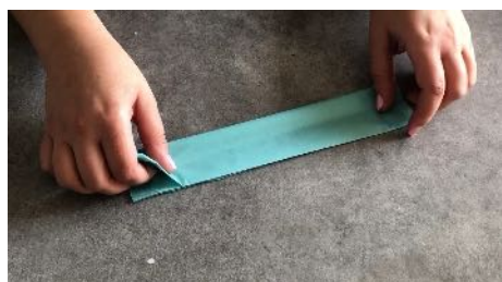
Plier la feuille plusieurs fois sur elle même