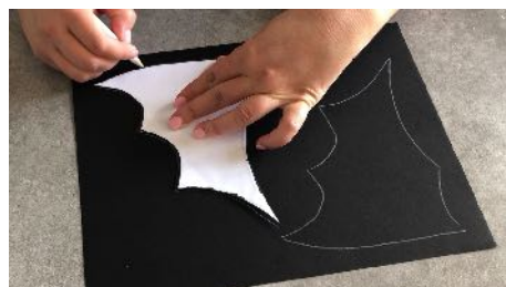
Reporter sur le papier noir