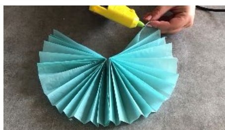
Coller les 2 demis rosaces ensemble