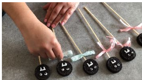
Nouer un ruban autour Des bâtonnets