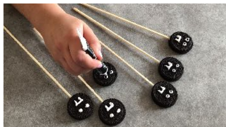
Mettre une pointe de stylo alimentaire noir dans les yeux