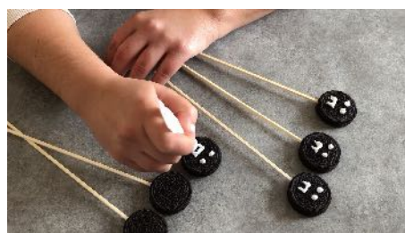
Dessiner les yeux et les Dents avec le stylo Alimentaire blanc