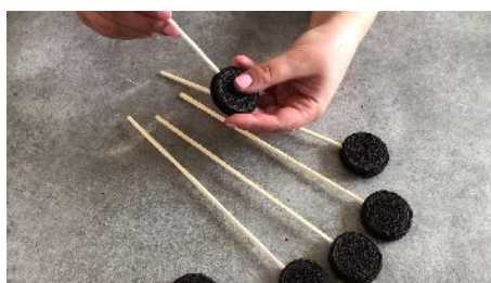
Planter les bâtonnets Dans les Oréos