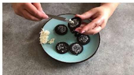
Séparer quelques Oréos Et vider la crème