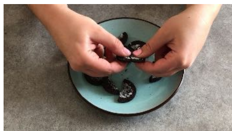
Casser les en 2