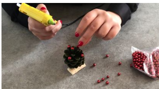
Coller les boules rouges sur la pomme de pin