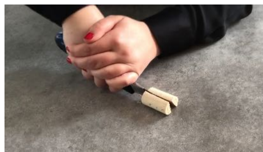
Couper le bouchon en 2