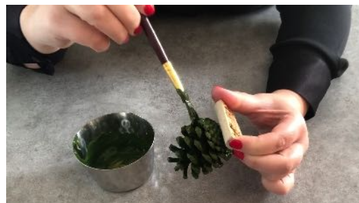
Peindre la pomme de pin en vert