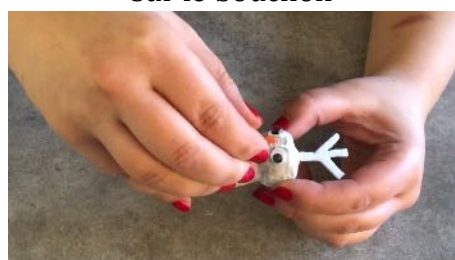
Coller le nez sur le bouchon