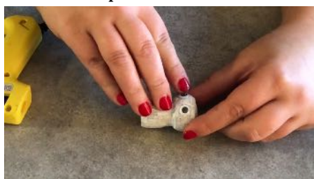
Coller les yeux