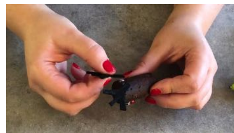
Coller les bois sur le bouchon