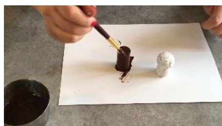
Peindre un bouchon en blanc et l'autre en marron