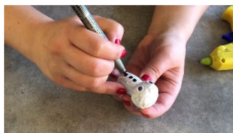
Dessiner les boutons sur le bouchon