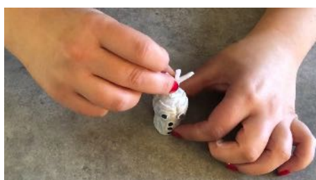
Coller les cheveux sur le bouchon