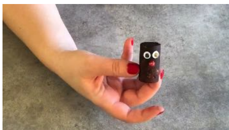
Coller une boule rouge pour le nez