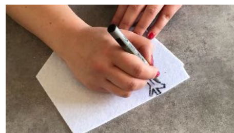
Dessiner les cheveux sur la feutrine blanche