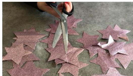
Découper les étoiles