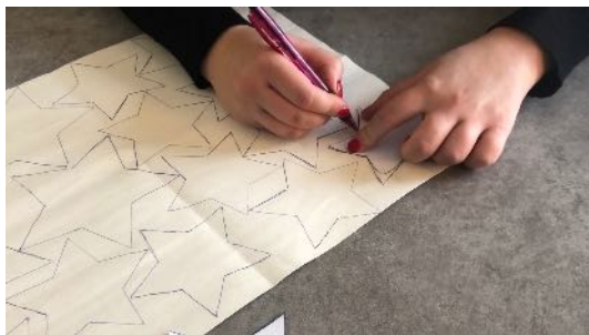
A l'aide des gabarits reporter les étoiles sur le tissu