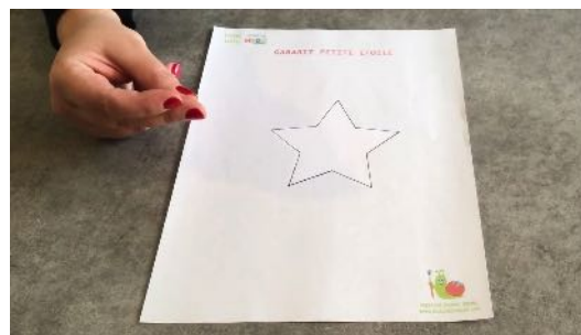
Imprimer et découper les gabarits