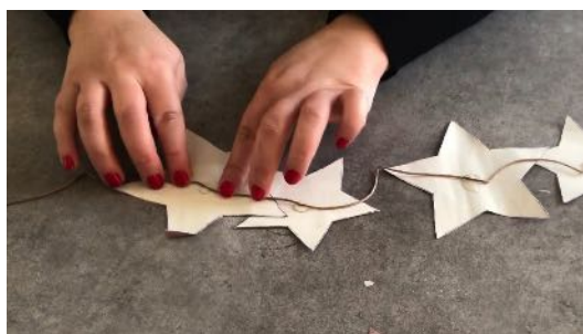
Coller les étoiles sur la corde