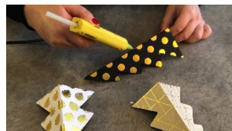
Mettre de la colle sur l'arête du sapin