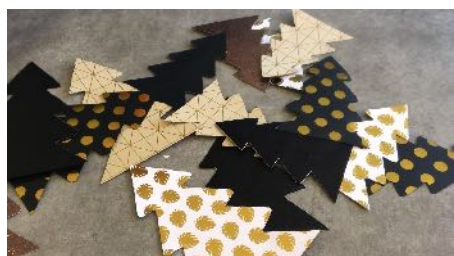
Découper les sapins