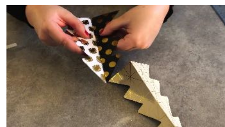
Coller 3 sapins ensemble