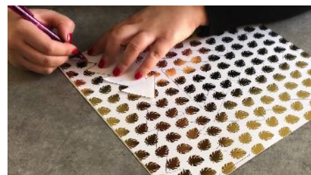
Reporter les sapins sur les feuilles cartonnées