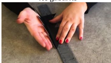
Plier les sapins en 2 à l'aide d'une règle