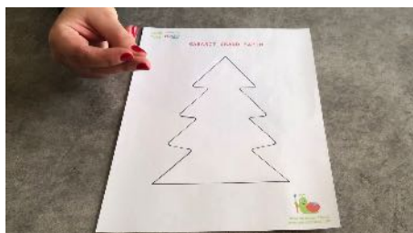
Imprimer et découper les gabarits