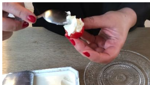
Remplir la tomate avec Le fromage frais