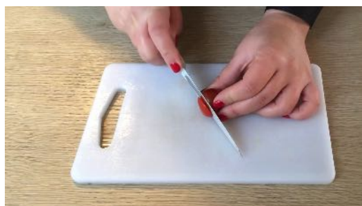
Couper la tomate au niveau du haut