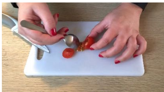
Vider la tomate