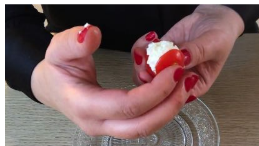
Mettre le haut de la tomate sur Le fromage frais