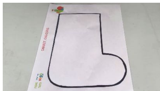
Imprimer et découper Le gabarit en pdf