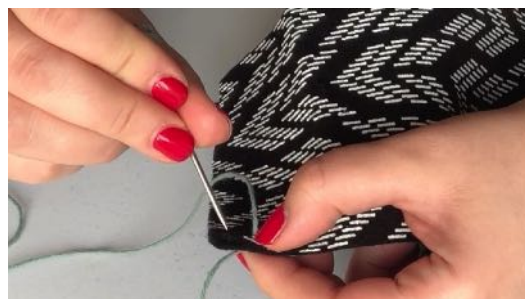
Coudre les 2 pièces ensemble Envers contre envers