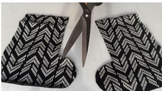
Découper 2 fois le gabarit dans la feutrine