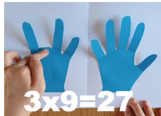
2 avant, 7 après... 3 \times 9 = 27