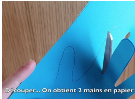
Découper... On obtient 2 mains en papier