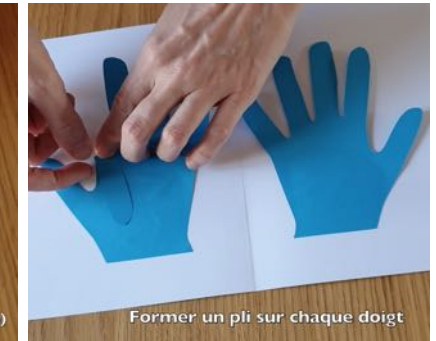
Former un pli sur chaque doigt