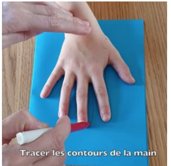
Tracer les contours de la main