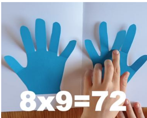
7 avant, 2 après... 8 \times 9 = 72