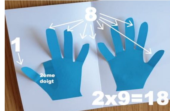
On plie le 2, 1 doigt avant, 8 après, 2 \times 9 = 18