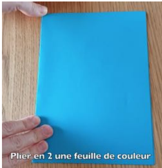
Plier en 2 une feuille de couleur