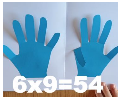
6 avant, 3 après... 7 \times 9 = 63