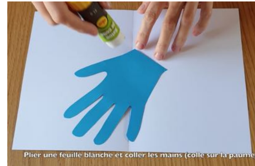
Plier une feuille blanche et coller les mains (colle sur la paume)