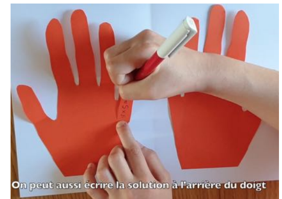
On peut aussi écrire la solution à l'arrière du doigt