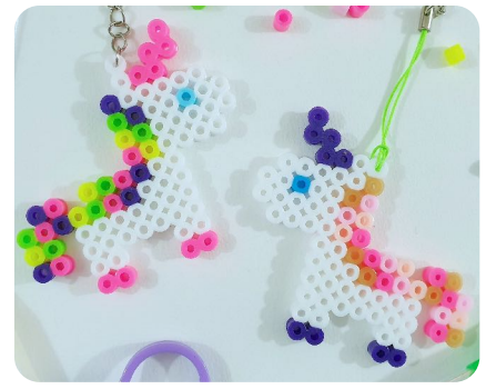
MODELE 1: LICORNE ENTIERE