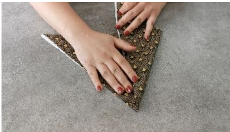
Replier la pointe gauche vers le milieu du triangle