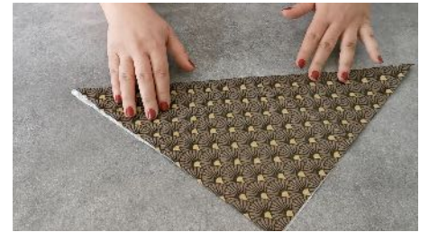
Plier la serviette en triangle