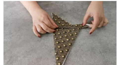
Plier le bas de la pointe gauche sur elle même