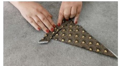
Replier de nouveau la pointe sur elle même