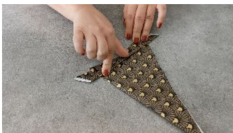
Plier la pointe gauche vers le bas en recouvrant légèrement la pointe droite