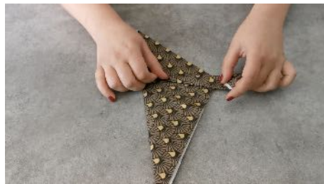
Replier de nouveau la pointe sur elle même