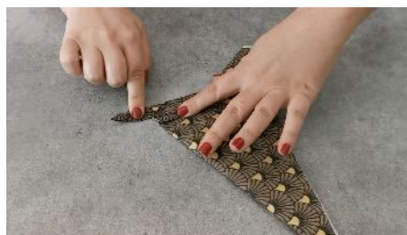
Plier la pointe droite vers le bas