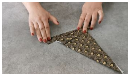
Plier l'autre pointe sur elle même