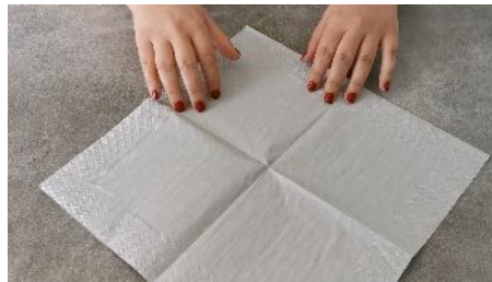
Déplier la serviette