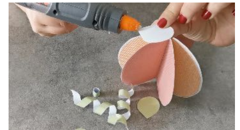
Coller les feuilles sur le haut de la citrouille