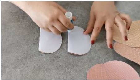
Encoller une moitié du gabarit