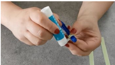
Enrouler une bande sur elle-même autour du stylo