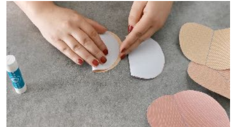
Plier en 2 les gabarits