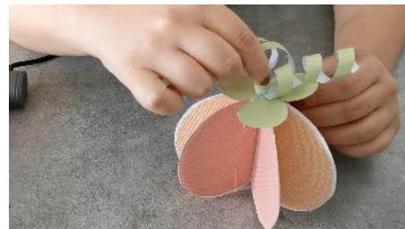
Coller la queue sur le haut de la citrouille