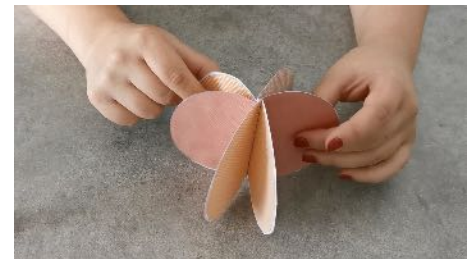
Coller toutes les parties ensemble