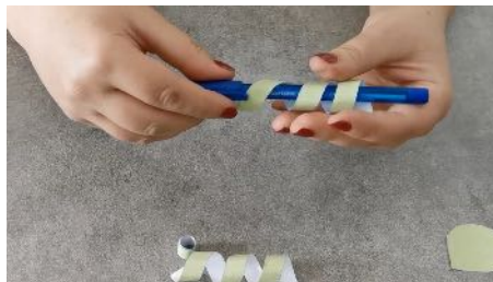
Enrouler les 2 autres bandes le long du stylo