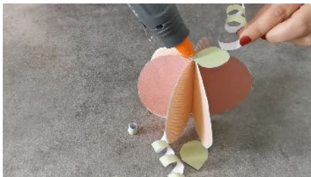
Coller les ramifications