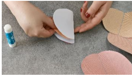
Coller 2 moitié l'une sur l'autre