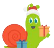
Mettre le dernier rouleau au sommet du calendrier