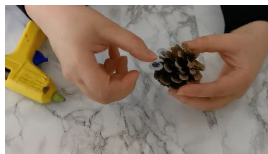
Coller les yeux amovibles sur les écailles de la pomme de pin