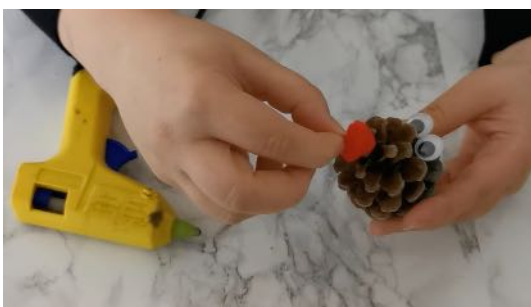
Coller le pompon rouge sur la pointe de la pomme de pin