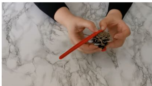
Coller le fil chenille à la base de la pomme de pin