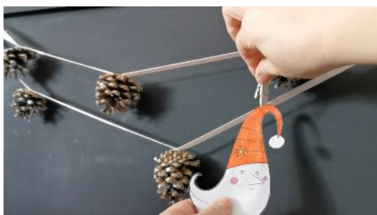
Accrocher les coloriages sur la guirlande