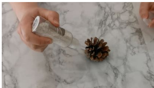
Saupoudrer les pommes de pin de paillettes