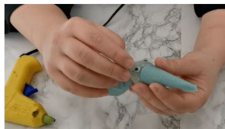
Coller les yeux sur le pompon