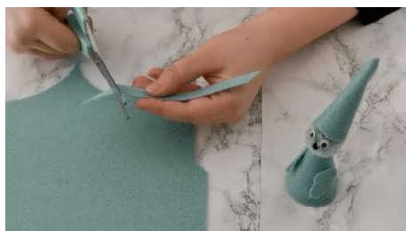
Découper une petite bande dans la feutrine