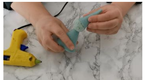
Coller l'autre cône sur le pompon