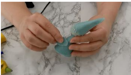
Coller les gants sur les côtes du corps du lutin