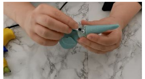
Coller la perle sur le pompon