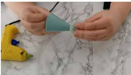
Coller le pompon sur le plus gros cône