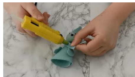
Coller l'écharpe autour du cou du lutin