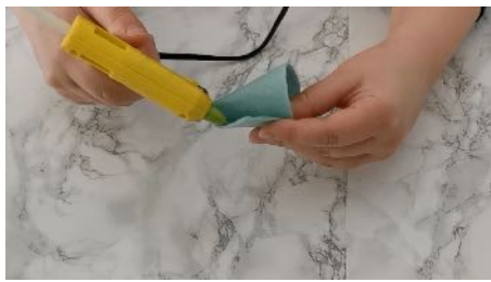
Former 2 cônes avec la feutrine