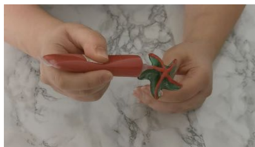
Mettre du glaçage sur la sucette