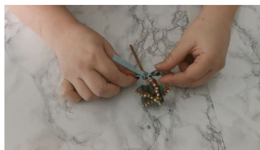
Nouer le ruban sur le bâton