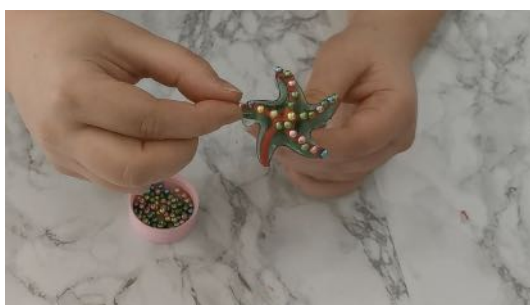
Placer les perles en sucre sur le glaçage