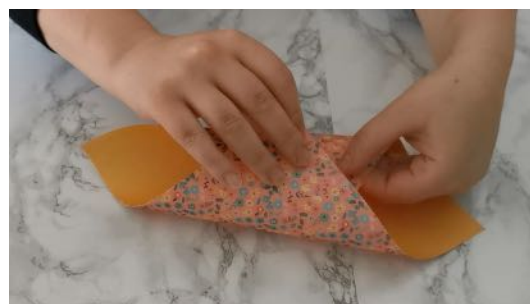
Rabattre 2 pointes vers l'intérieur