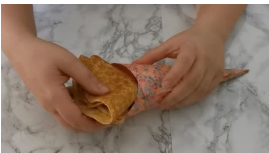
Placer 2 crêpes dans votre cornet