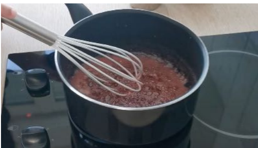
Cuire le caramel