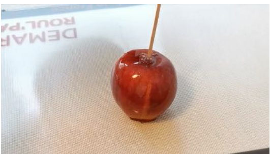
Laisser durcir le caramel