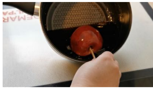
Tremper la pomme dans le caramel