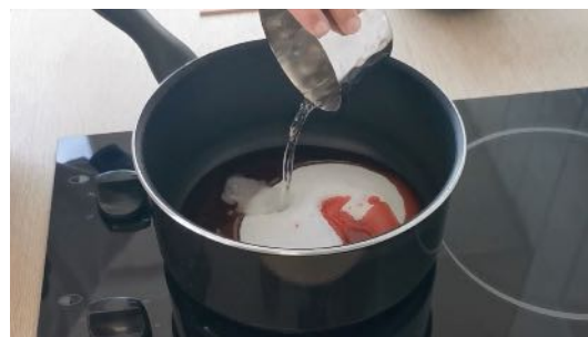
Mettre les ingrédients du caramel dans la casserole