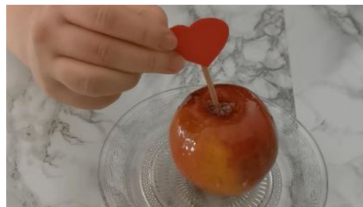
Coller un cœur sur le bâton