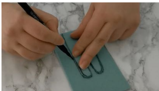
Reporter la forme sur la feutrine