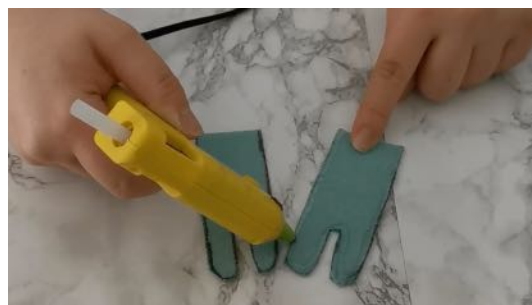
Coller les formes ensemble