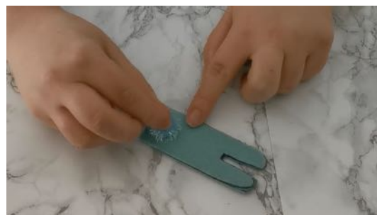
Coller un pompon au dos du lapin