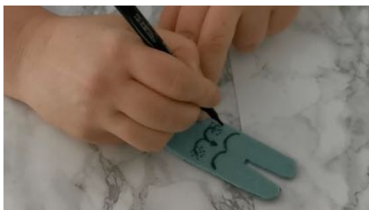
Dessiner des yeux et museau sur le lapin