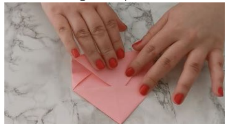
Rabattre la pointe à l'intérieur de l'autre triangle