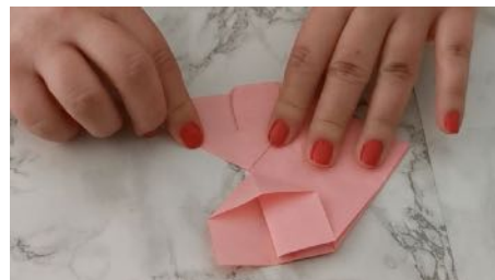
Ouvrer les rectangles en formant les pointes en triangle