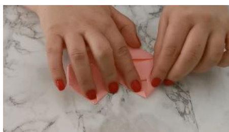
Plier en triangle les pointes