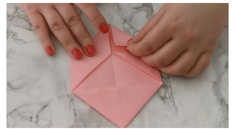
Plier les pointes vers les triangles déjà formés