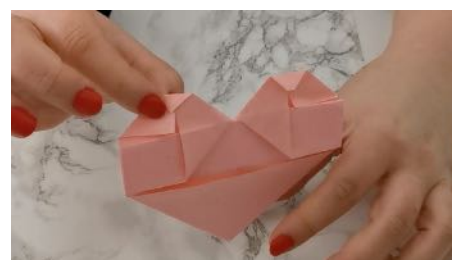
Rabattre les 2 petites pointes