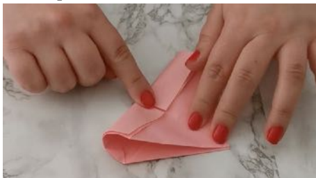
Plier en 2, pointe sur pointe