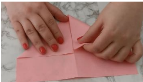
Tourner la feuille et plier en pointe vers le centre