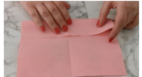
Plier un côté vers le centre