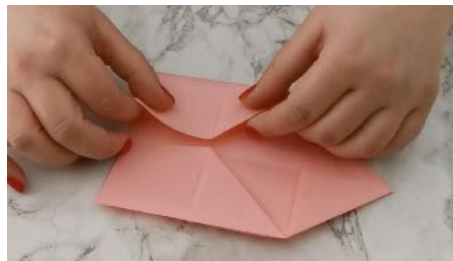
Tourner la feuille et rabattre les côtés vers le centre