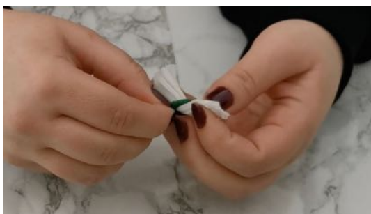
Placer le crépon au bout d'un fil chenille en le serrant