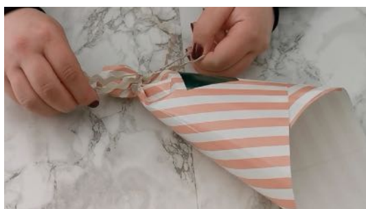
Fabriquer un joli cornet