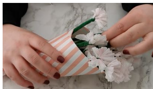
Placer les fleurs dans le cornet