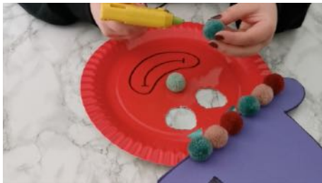
Coller le chapeau sur l'assiette Coller les pompons dessus