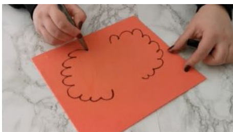
Dessiner des formes de cheveux bouclés sur une feuille mousse, découper