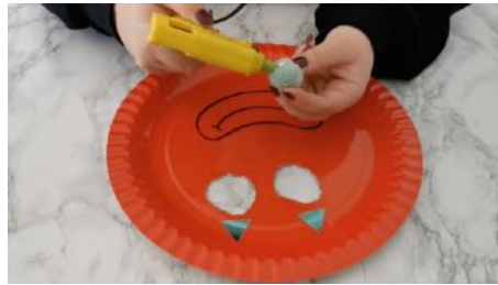
Dessiner la tête de clown sur l'assiette, découper les yeux, coller le nez et les gommettes