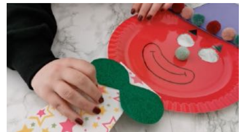
Coller la cravate sur l'assiette