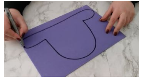
Dessiner un chapeau sur une feuille mousse, découper