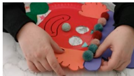
Coller les cheveux sur l'assiette