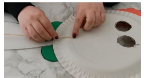
Coller le bâton au dos de l'assiette