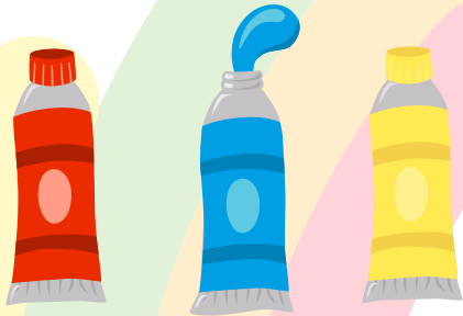
Rouge Bleu Jaune