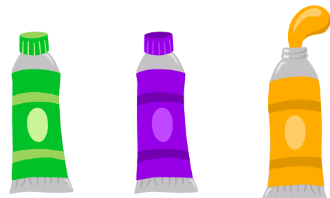
Vert Violet Orange