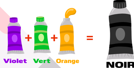
Violet Vert Orange