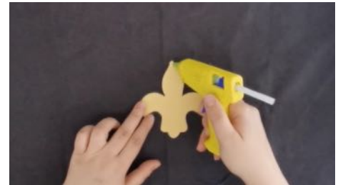
Imprimer, découper et reporter le gabarit sur une feuille de couleur et coller sur le tissu