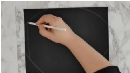
Dessiner à main levée une forme de bouclier, découper