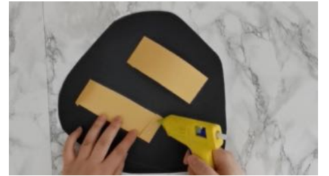
Coller au dos du bouclier 2 poignées