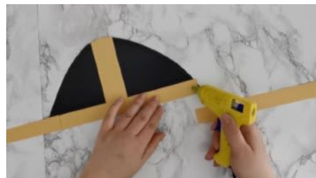
Découper des bandes de couleur et coller-les sur la couronne