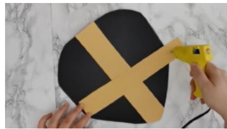
Découper des bandes de couleur et coller-les sur le bouclier