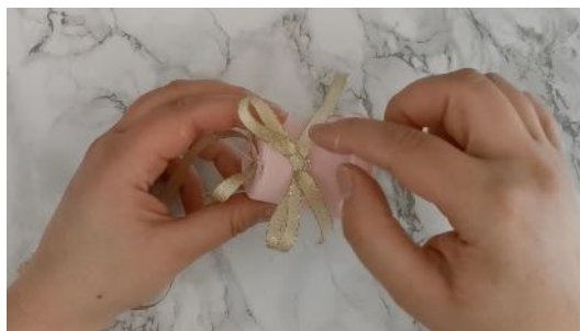
Faire un nœud avec le ruban Le coller sur le devant du pot