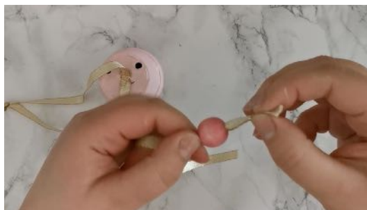
Enfiler une perle dans un bout de ruban