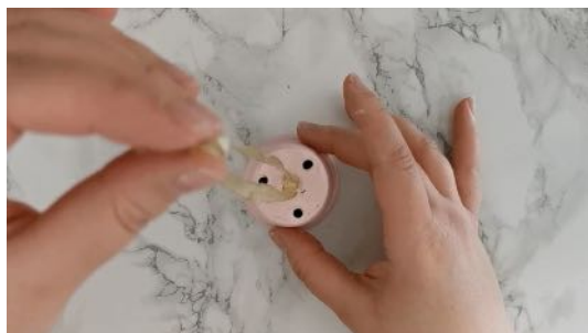
Coller un bout de ruban sur le haut du pot