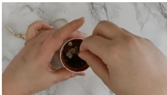
Coller le ruban à l'intérieur du pot