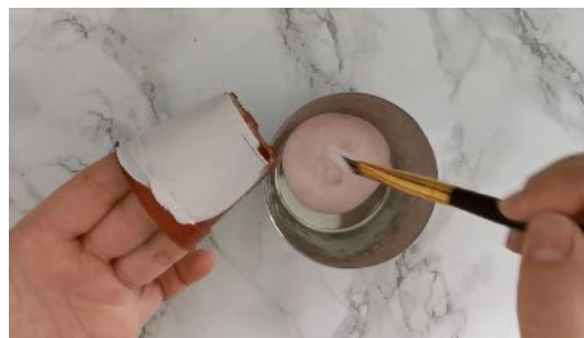
Peindre le pot avec la peinture