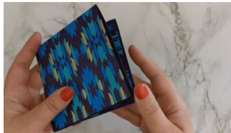
Replier pour obtenir un carré Faire les mêmes étapes pour les 4 feuilles