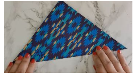
Plier la feuille dans la diagonale