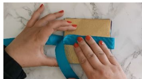
Coller le ruban au dos de l'album