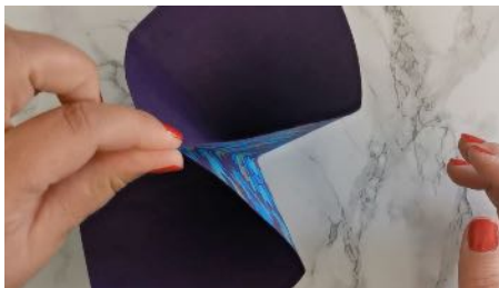
Ramener les pointes vers l'intérieur, vers le haut