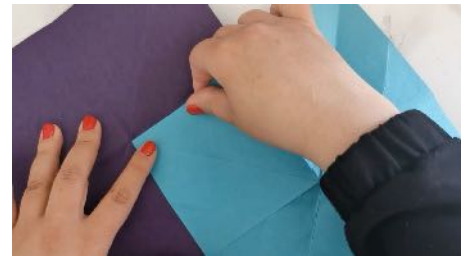
Coller les feuilles entre elles