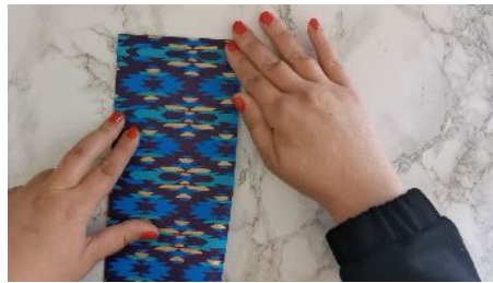
Plier la feuille en 2 dans un sens puis dans l'autre