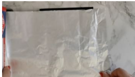
Coller du papier aluminium sur la feuille cartonnée