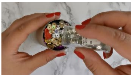
Placer le rond transparent à l'autre extrémité, verser des sequins dessus