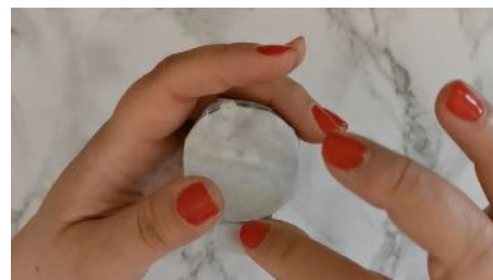
Fermer ce côté avec le rond de papier cuisson