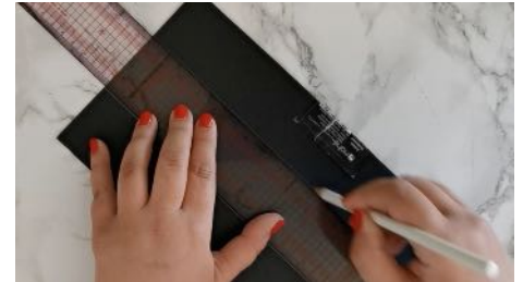
Diviser la feuille en 3 dans la largeur