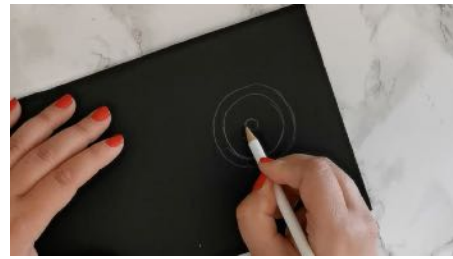
Tracer un rond au diamètre du rouleau ajouter 1 cm autour et un rond au centre