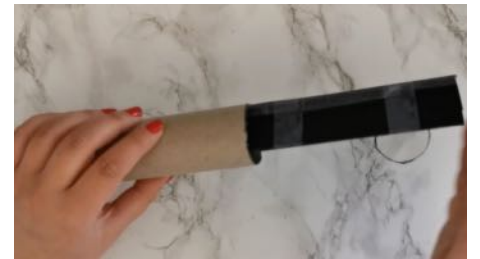
Placer le triangle dans le rouleau, fermer un côté du rouleau avec le rond noir