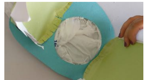
Coller les mâchoires sur la tête du crocodile