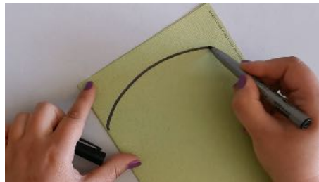
Plier la feuille cartonnée en 2 Dessiner la mâchoire du crocodile découper