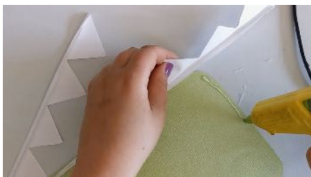
Coller les dents sur les mâchoires