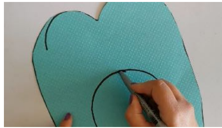
Dessiner la forme de la tête du crocodile et un rond au centre découper