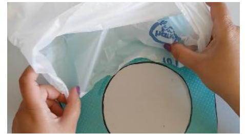
Coller le sac poubelle au dos autour du rond