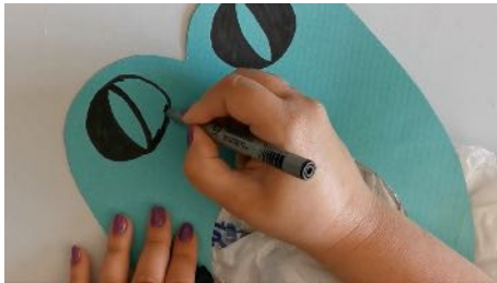
Dessiner les yeux