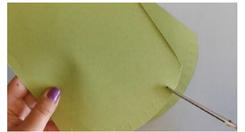
Cranter les 2 morceaux qui forment la mâchoire du crocodile