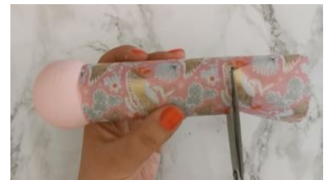
Enrouler le rouleau de papier toilette de la feuille à motif japonisant, couper l'excédant