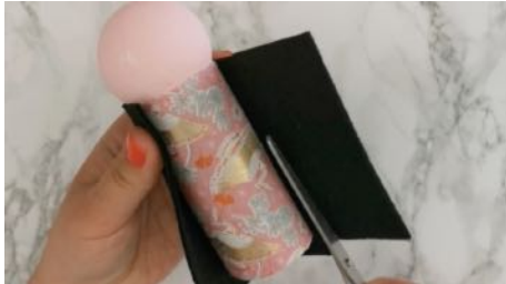
Couper un carré de feutrine noir au \frac{3}{4} du tour du rouleau Et à la même hauteur