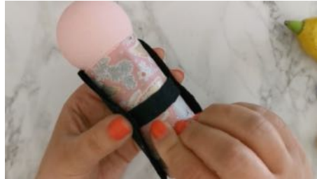
Coller sur le rouleau la feutrine et une bande de feutrine au milieu