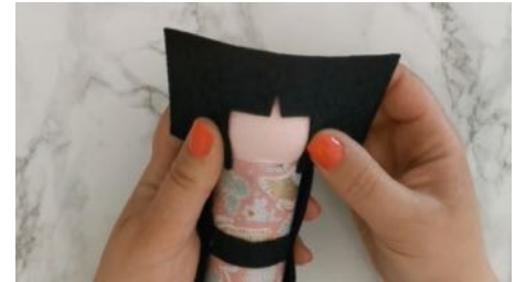
Découper dans la feutrine noire un rectangle pour créer les cheveux, coller.