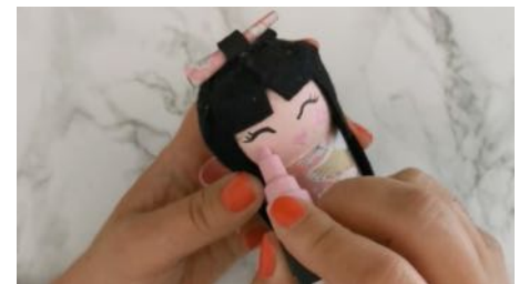
Dessiner les yeux, la bouche et les joues roses