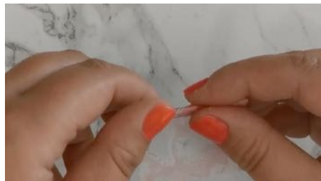
Rouler un petit bout de papier japonisant, ajouter un peu de feutrine, coller sur la tête