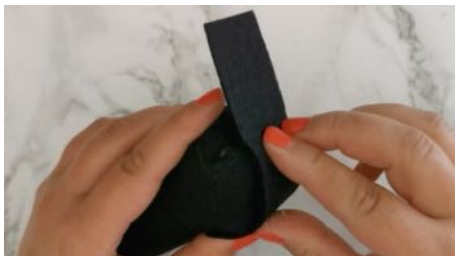
Coller une bande de feutrine à l'arrière de la tête pour fermer complètement.