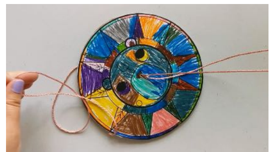
Passer la corde dans le trou Faire un nœud aux extrémités