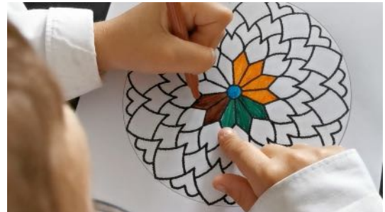
Colorier les 2 mandalas