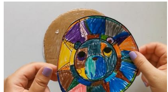
Coller le 2ème mandala sur l'autre face du carton