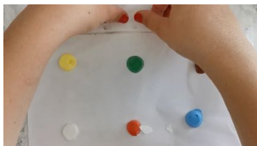
Mettre du scotch pour maintenir la feuille sur la table