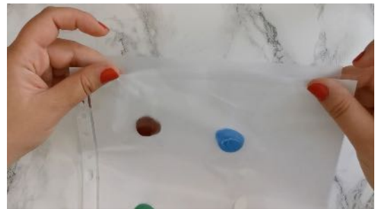
Fermer l'ouverture de la feuille transparente avec du scotch