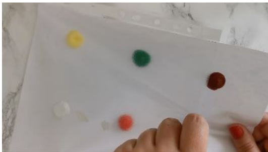
Glisser la feuille blanche dans la feuille transparente