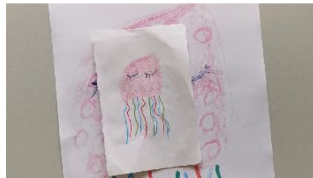
Augmenter la taille du dessin avec l'imprimante, découper le model