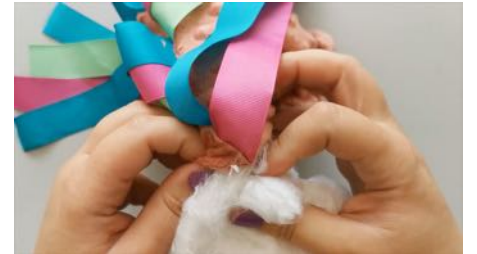
Rembourrer le doudou, en insérant la ouate par l'ouverture.