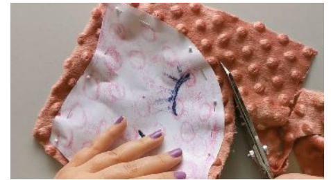
Placer le model sur le tissu plié en 2, découper avec une marge de 1cm autour.