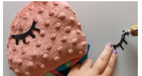
Coller les yeux avec la colle spéciale tissu