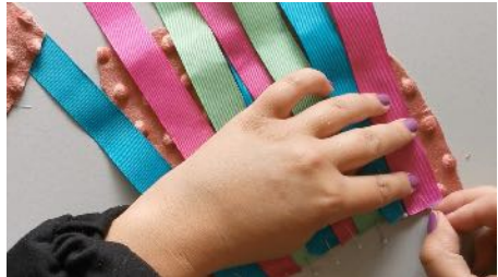
Placer les rubans sur le tissu, puis placer l'autre partie du tissu dessus, endroit contre endroit