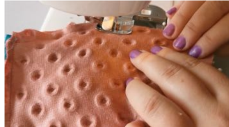
Coudre tout le tour en laissant une ouverture de 4 cm, pour retourner le doudou.