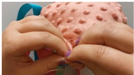
Fermer l'ouverture, en réalisant une couture à la main.