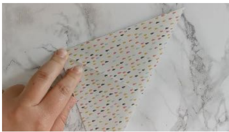
Plier la feuille en triangle Dans les 2 sens