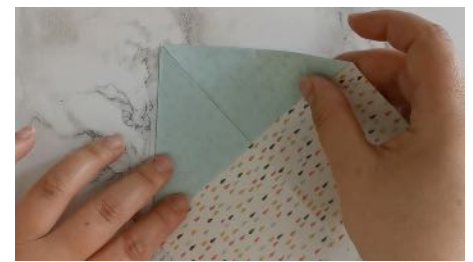
Ouvrir la feuille, puis plier les Coins supérieurs vers le centre, En formant des triangles