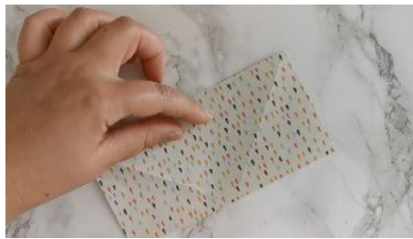
Plier la feuille en 2