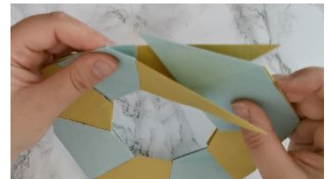
Fermer le frisbee en Rejoignant le 1 er losange Avec le dernier