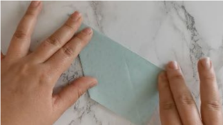
Plier la feuille en 2