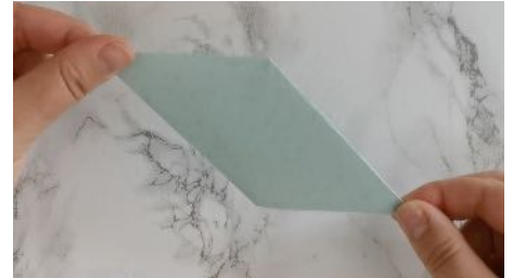
Replier le triangle, Pour obtenir un losange Faire les mêmes étapes pour les 8 feuilles