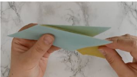
Assembler les losanges Ensembles à la suite