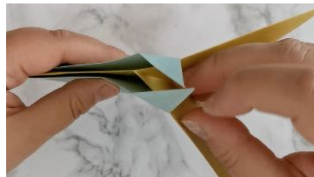
Plier les pointes qui dépassent et les glisser à l'intérieur du losange suivant