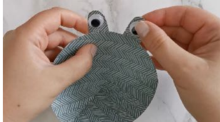
Découper des formes de yeux, Coller des yeux amovibles dessus, Puis les coller sur l'entonnoir