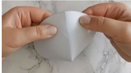
Former un entonnoir Scotcher pour maintenir