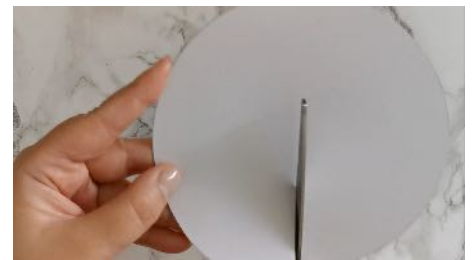
Découper le cercle Puis faire une fente