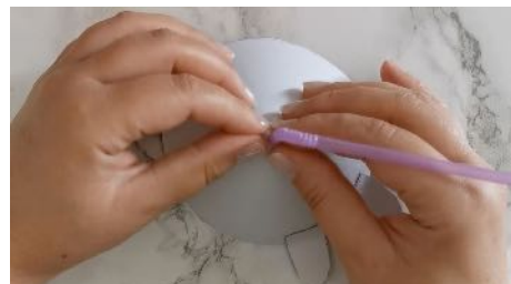
Insérer la paille dans le trou Scotcher pour la maintenir