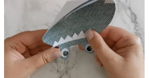
Dessiner des dents, Les découper, puis Les coller dans l'entonnoir