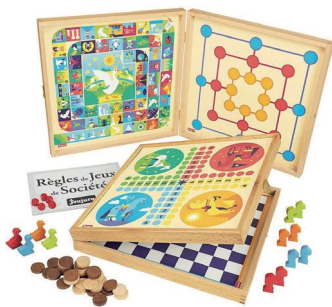
Jeux de société