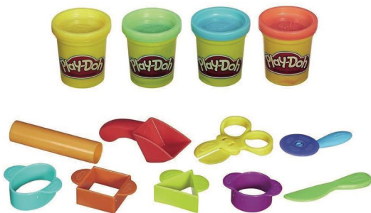
Pâte à modeler