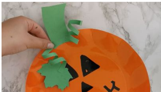
Coller le pédoncule et la feuille sur le haut de l'assiette