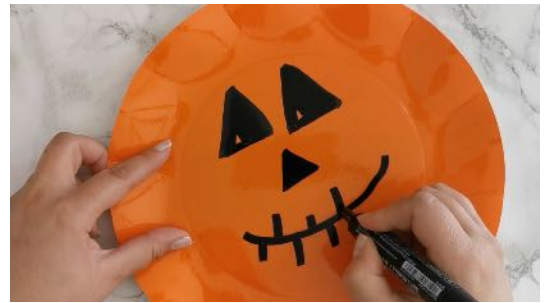
Dessiner les yeux, le nez et la bouche sur l'assiette