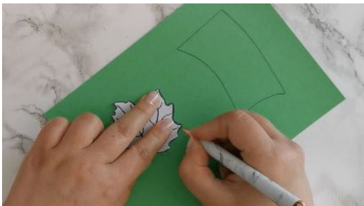
Dessiner le pédoncule et la feuille Découper