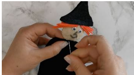
Découper une forme pour le corps, le coudre en y plaçant la tête et les bras