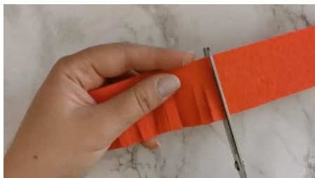
Découper une bande orange, cranter pour faire des franges