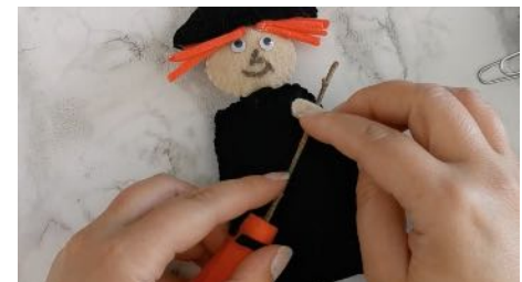
Coller le balai sur les bras de la sorcière