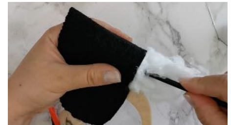
Rembourrer le corps et coudre l'ouverture