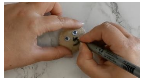
Coudre la tête et rembourrer, coller les yeux, dessiner le nez et la bouche