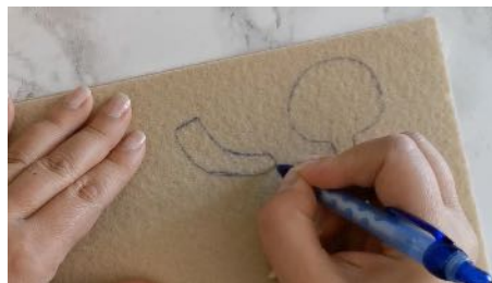
Dessiner 2 têtes et 2 bras sur la feutrine beige, découper