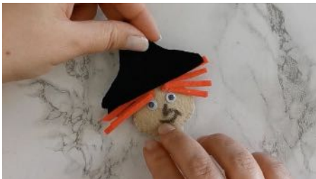
Découper 2 chapeaux, les coller sur la tête avec les cheveux