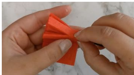
Enrouler la bande autour du bout de bois